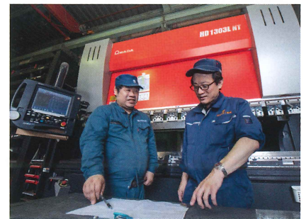
最新の機械を完備し、生産性・技術力を向上していく