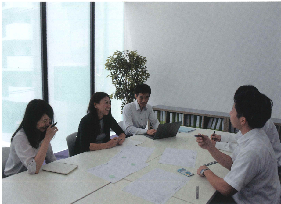
定例の設計会議で談笑する若手設計者たち